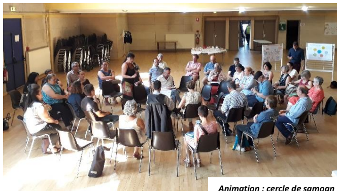
Animation : cercle de saooan