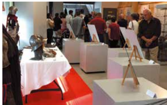
Inauguration de l'exposition Bataille de Castillon 1453

> l'exposition Bataille de Castillon 1453 , imaginée par la Mairie, le GRHESAC et le Musée de l'Armée de Paris. Cette deuxième édition gratuite se voit complétée par un ensemble d'objets lié à l'équipement du soldat : casque, gant, veste, cuirasse, mais aussi épée !