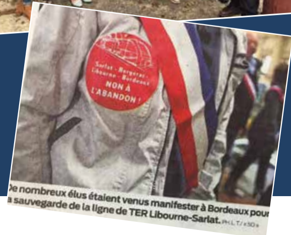
Le nombreux élus étaient venus manifester à Bordeaux pour la sauvegarde de la ligne de TER Libourne-Sarlat. (P+L 7/130)