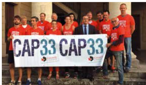
Lancement de Cap 33

Après une année test en 2016, Cap 33 se déploie à nouveau sur le territoire de la Communauté de Communes Castillon-Pujols. Du lundi au samedi en juillet et en août, pratiquez le badminton, le basket, le yoga, la calligraphie ou encore l'origami. Sur place, des animateurs vous accueillent et s'occupent de vous. Les heures « découverte » sont totalement gratuites et ouvertes à tous.