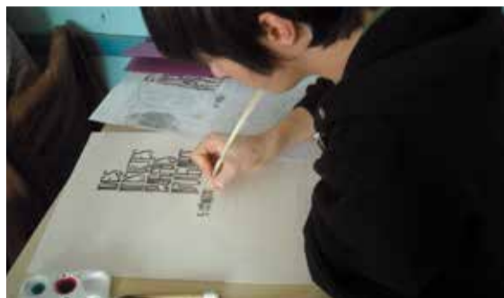
Les ateliers médiévaux

> les ateliers médiévaux , organisés par la Médiathèque avec l'appui du CLEM. Deux ateliers gratuits sont proposés cette année : la calligraphie, pour écrire un texte à la plume d'oie, et le bestiaire, pour créer un animal chimérique à partir d'enluminures.