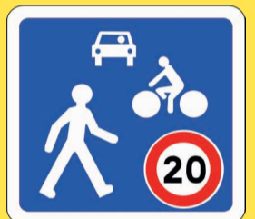
Panneau de zone de rencontre

Plusieurs dispositifs ont été testés avec succès :