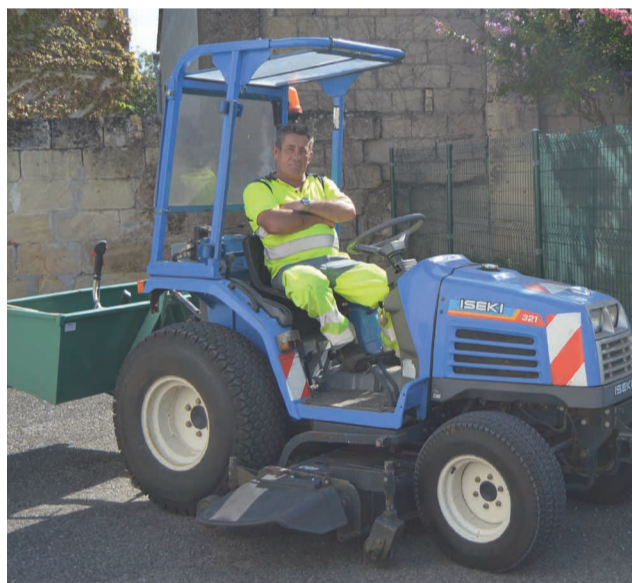
Le tracteur est utilisé pour la tonte et le désherbage

Lors de la réunion du Conseil municipal du 18 juillet en effet, une décision modificative du budget communal a permis d'allouer 237 000€ pour soutenir des projets d'investissement. En voici les principaux :