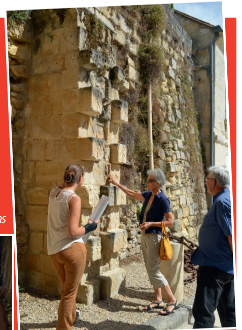
Visite de la ville - la porte de fer