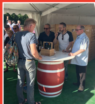
Dégustation par le Syndicat des vins à Castegens