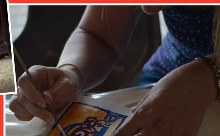
Atelier enluminure à la Médiathèque