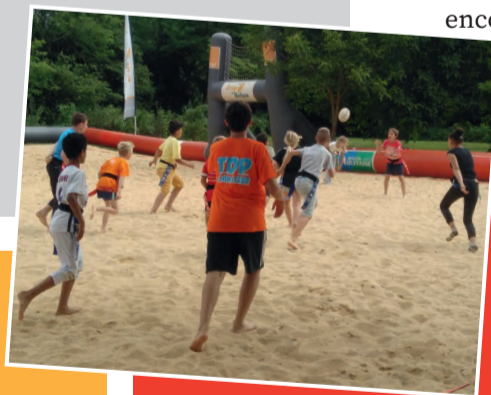
Activité rugby à la pelouse