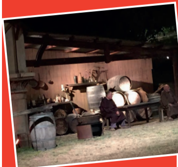
Spectacle de la Bataille