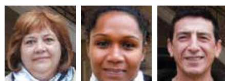
District 13 Marie-José Peru

Pour plus de renseignements, joindre la coordinatrice du recensement à l'accueil de la Mairie : Mme Sylvie Vigier au 05 57 40 00 06.